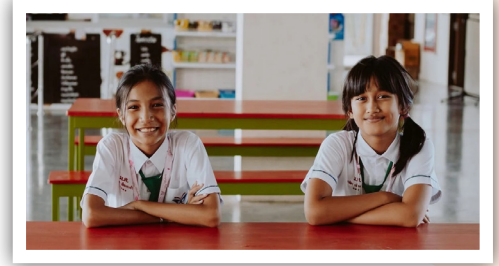
Skolehjelp tas imot med glede.