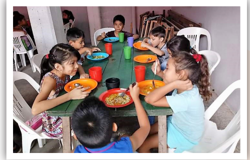
Deilig mat og trivsel rundt bordet.