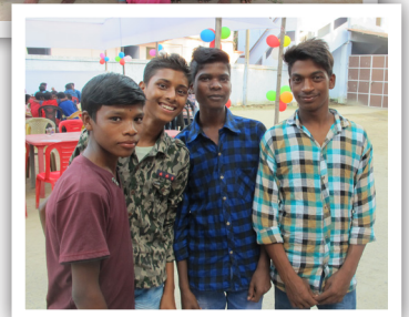
Tenåringsgutter som tidligere har fått oppfølging med skole m.m.