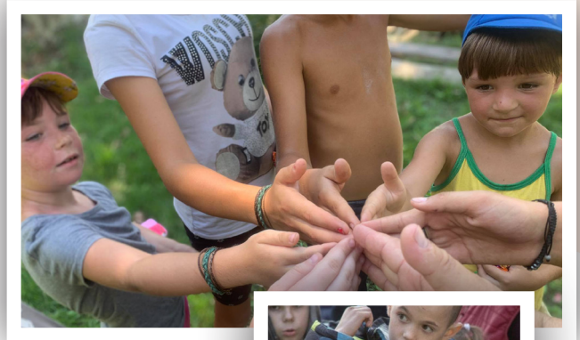
Fra en sommerleir i Ukraina 2021