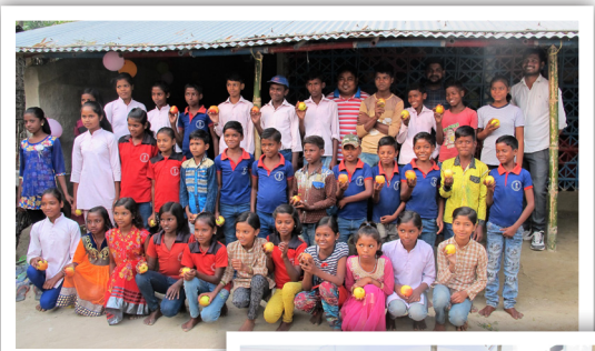
Glade dalit barn på ett av sentrene