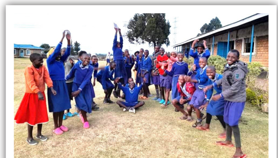
Takknemlige tenåringer som får gå på skolen