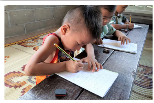
Fra samling for shanbarna i Fang, Thailand.