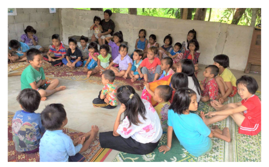
Skole for shanbarn fra Burma, som misjonen driver.